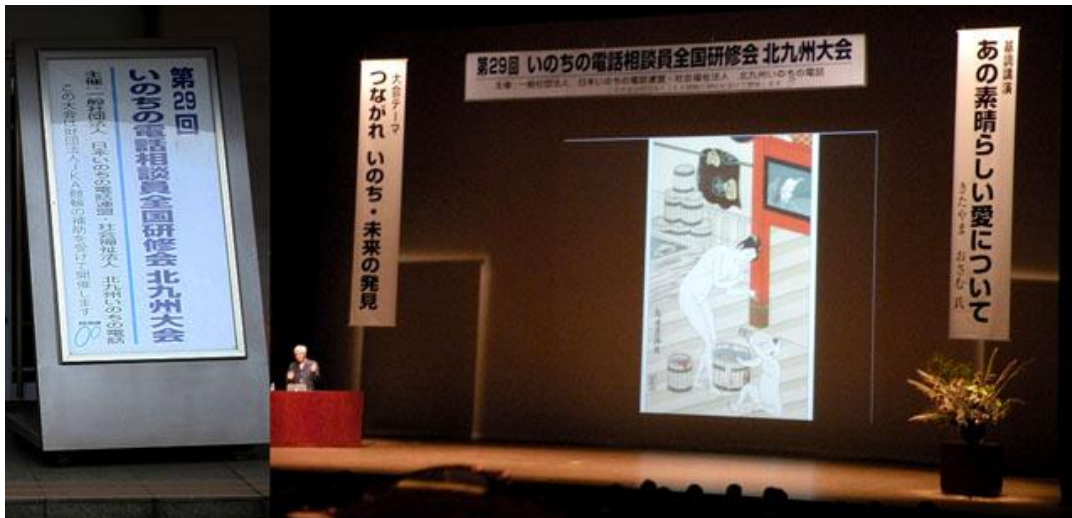
23年度 立て看板及び基調講演