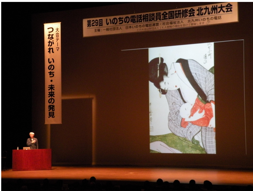
23年度 基調講演その2