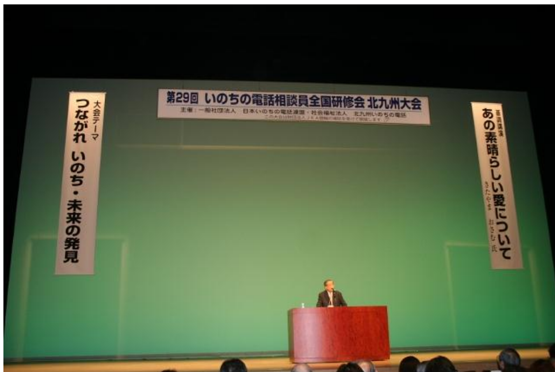
23年度 開会式理事長あいさつ